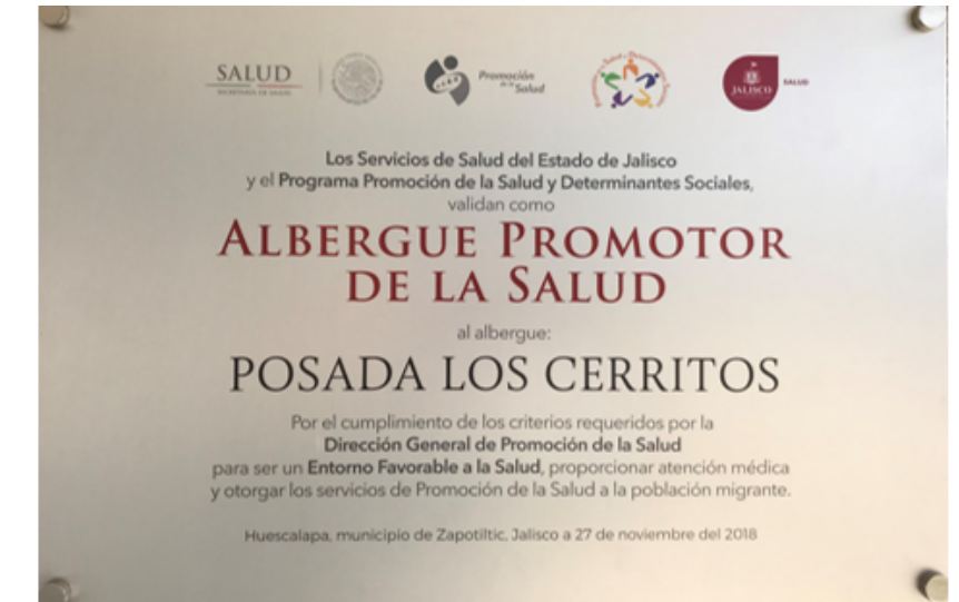
Albergue Promotor De la Salud