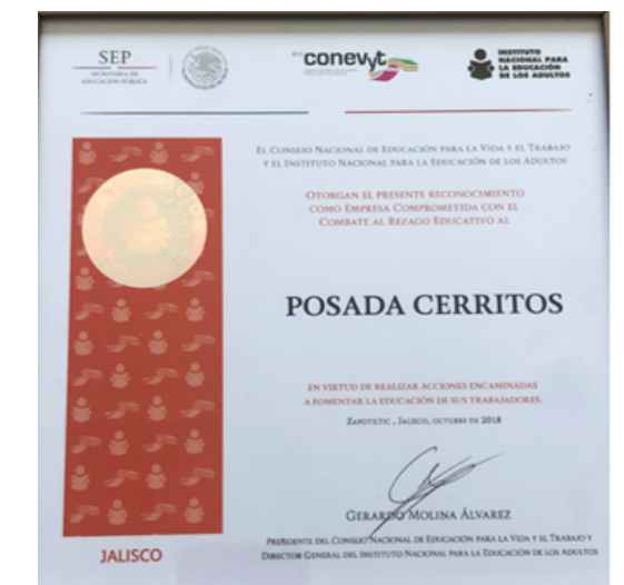
Empresa comprometida con la educación de los trabajadores