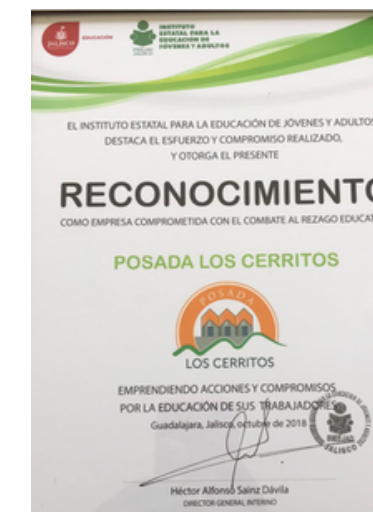
Empresa comprometida con el combate al rezago educativo