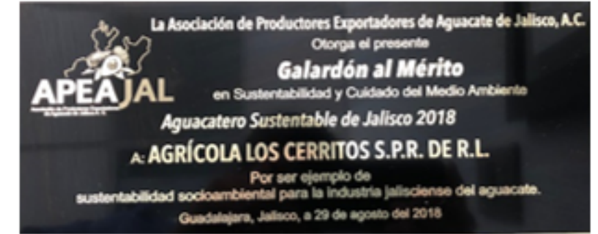
Galardón al mérito en Sustentabilidad y Cuidado del Medio Ambiente